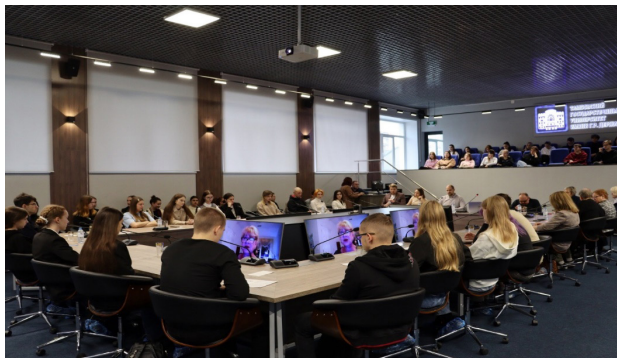
Рисунок 1 – Открытие XI Международной научной студенческой конференции «Общество, общности, человек: в поисках «вечного мира», Стромов-Центр Тамбовского государственного университета имени Г.Р. Державина, 15 ноября 2024 года

социологи из г. Аннандейл (шт. Вирджиния, США) и г. Самарканда (Республика Узбекистан), Рисунок 1.